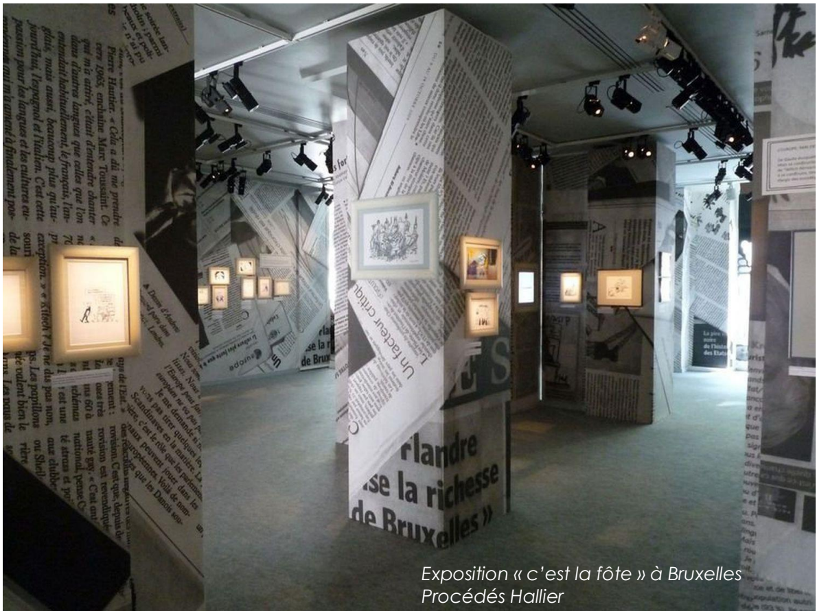
Exposition « c'est la fête » à Bruxelles Procédés Hallier