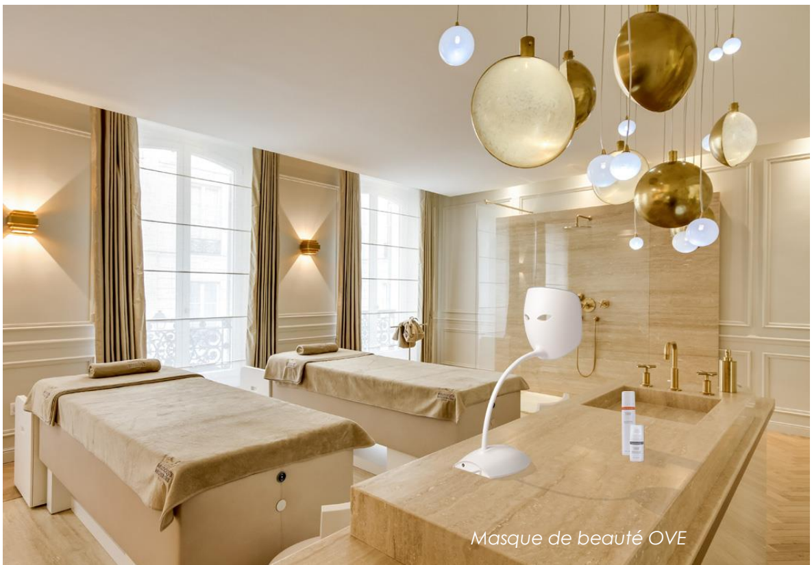
Masque de beauté OVE